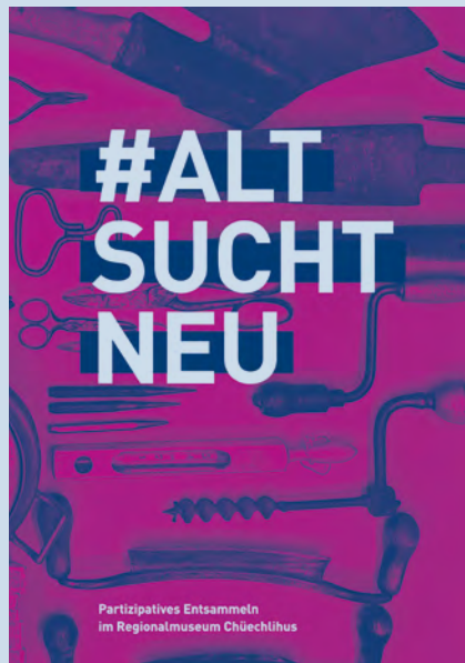
Titelbild Publikation #ALTSUCHTNEU

en lien avec le patrimoine culturel au passé problématique. Elle pourra être saisie lors de cas litigieux et émettre des recommandations non contraignantes concernant des œuvres d'art spoliées à l'époque du national-socialisme ainsi que des biens culturels issus d'un contexte colonial. Plus d'informations